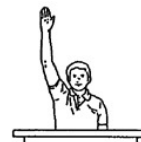
クロックを止める・止めておくとき