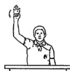
クロックを動かし始めるとき