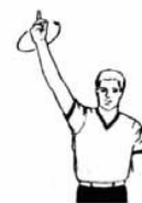
24秒及び14秒リセットの合図