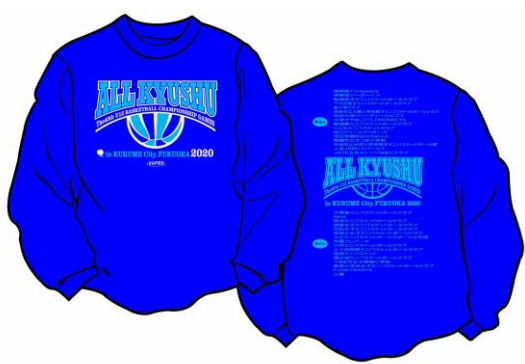
<ブルー(ロングスリーブのみ)>