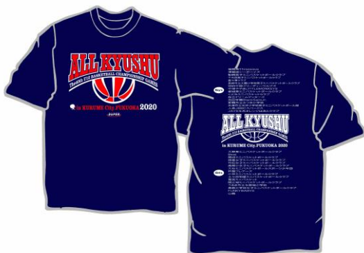
<ネイビー(Tシャツのみ)>